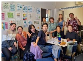
クラスメイトと一緒に

タウランガは、オークランドから車で約3時間、ニュージーランド北島のリゾート地です。ニュージーランド随一の人気を誇るビーチタウンで、温暖で風光明媚な土地柄ゆえ、若者から年配の方まで幅広い年齢層に大変人気のある街です。学校は、タウランガのベイエリアに2012年に開設された「バイ・ラーニング・アカデミー」です。世界各国からの留学生と経験豊富な教師の距離がとても近く、アウトホームな雰囲気です。この研修では、出発前に行う筆記テストと、現地でおこなうリスニング・スピーキングテストの結果で、ご自身のレベルに合ったクラスで受講いただきます。そのため、初心者の方から英語が得意な方までご参加いただけます。