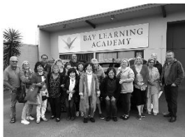
学校の前でホストファミリーと一緒に

世界各国からの留学生と経験豊富な教師の距離がとても近く、アットホームな雰囲気です。この研修では、出発前（又は初日）に行う筆記テストと現地でおこなうリスニング・スピーキングテストの結果で、ご自身のレベルに合ったクラスで受講いただけます。そのため、初心者の方から英語が得意な方までご参加いただけます。