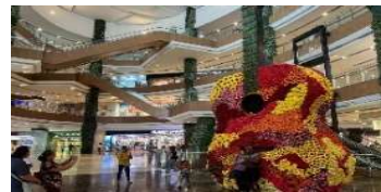
学校が入るロビンソンガレリア。様々な施設があり、一日中楽しむことができます。

ベトナムとインドネシアで7校を展開する日系のBrilliantグループが運営するプレミアム校。滞在するホテルと直結した大型モールに学校があります。大人の英語力向上にコミットし、安全、便利、快適のすべてが揃った環境で集中して学習いただけます。